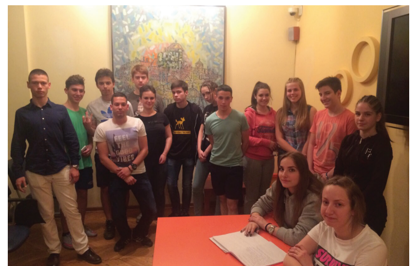
Чланови ученичког парламента на једном од састанака