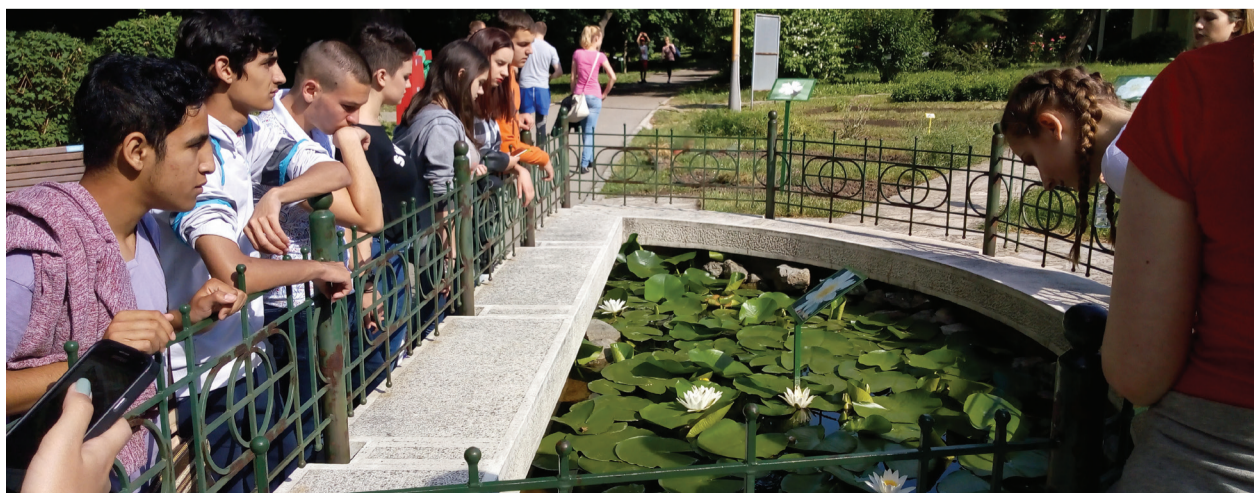
Ботаничка башта, основана је 1874. одлуком Министарства просвете Краљевине Србије, на предлог Јосифа Панчића, који је био и њен први управник. Ботаничка башта „Јевремовац“, учионица под отвореним небом