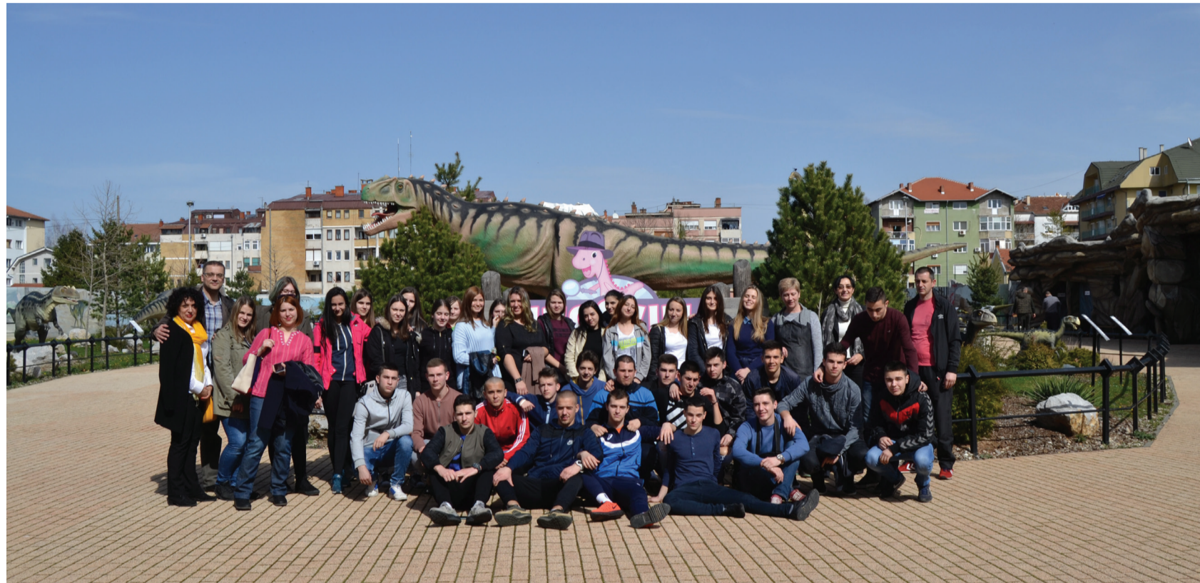
Средња пољопривредна школа са Домом ученика у Свилајнцу је и ове године позвала наш Дом у госте на такмичење и дружење. Радо смо прихватили позив који је уједно био и изазов за нас. Домаћини су, као и увек били љубазни. Наша очекивања су испуњена.