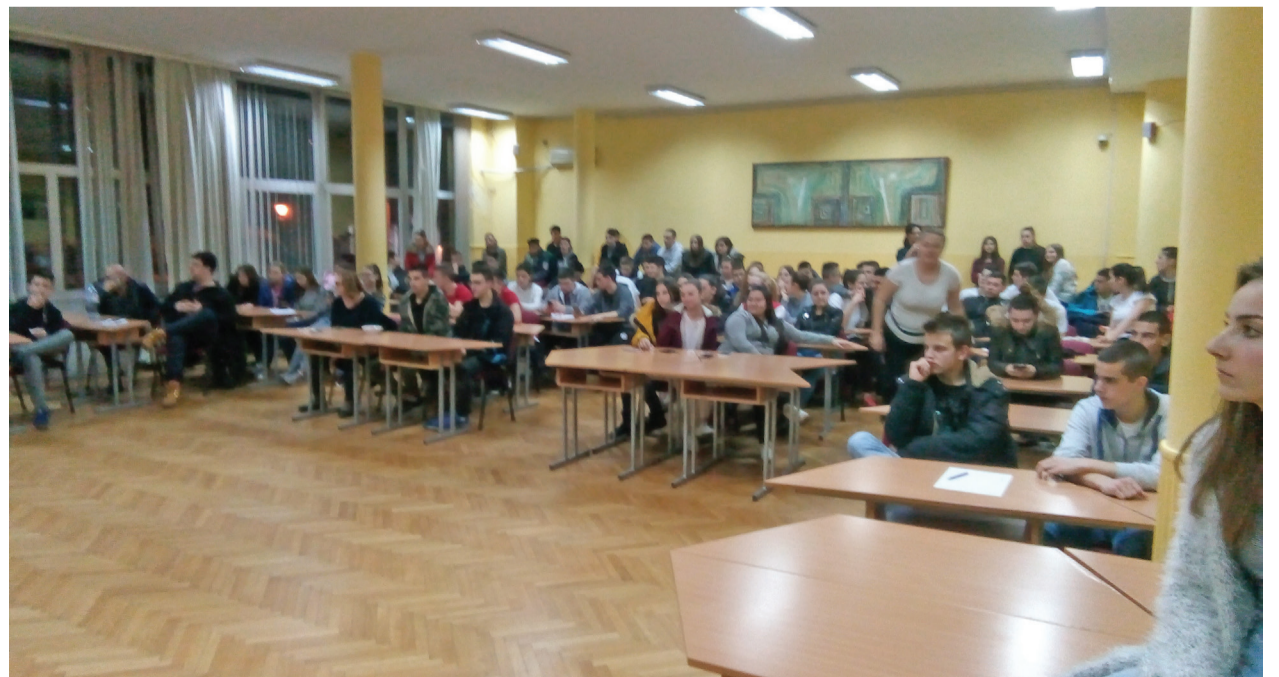
Хуманитарно вече је окупило велики број ученика и васпитача, који су својим присуством дали подршку поменутој акцији.

Жеља да путује светом, да буде успешна, да ради оно што воли и да уз њу увек буду породица и најбољи пријатељи – разлог су да не дозволи леукемији да победи.