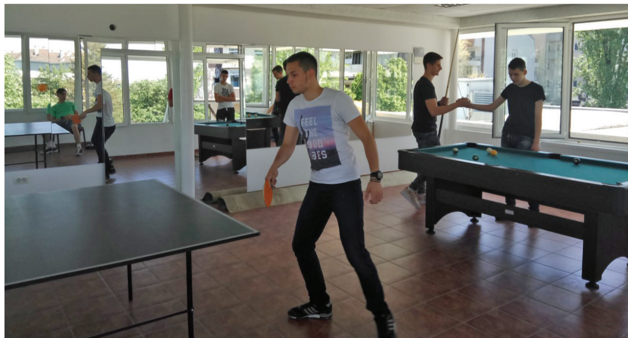
Термини боравка у сали су од понедељка до четвртка у периоду од 11–15 часова и од 18–20 часова. Ученицима су на располагању столови за билијар, стони фудбал, стони тенис, као и пикадо