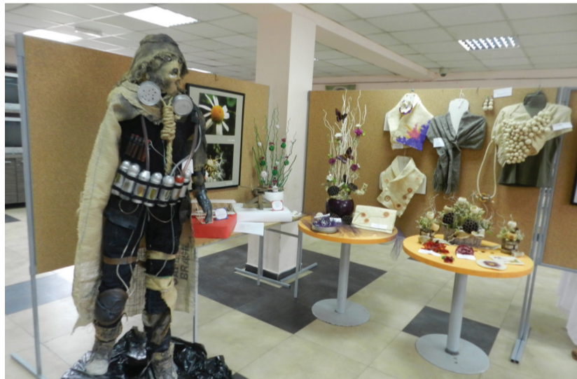
Награђени костим „Жика“. Костим и лутку су креирали чланови Креативне секције, коју води васпитачица Верослава Ристић

категоријама. Освојили смо прво место за костим „Жика“ у области примењене уметности. Макетарска секција, освојила је прво и друго место. Фолклор је такође освојио прво место, друго место класична и популарна музика. Имали смо и најбољег играча у модерном плесу. Треће место - цветни аранжман, ликовни рад, уметничка фотографија и етно музика.