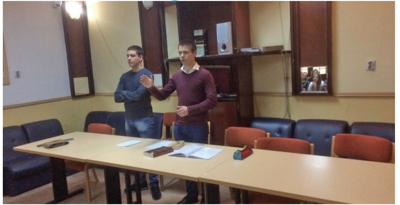
Говорило се о борби са тремом и страхом, говорило се о методама сређивања мисли, о ваљаној и примерној дикцији и гестикулацији, као и о врстама говорења и све то са пуно примера.

Будући већ четвртаци угледних београдских гимназија, уделили су нам и неколико савета о томе како треба одговарати, излагати, предавати, у уопште како се ваља држати у оним говорничким ситуацијама које сусрећемо у оквиру школе.